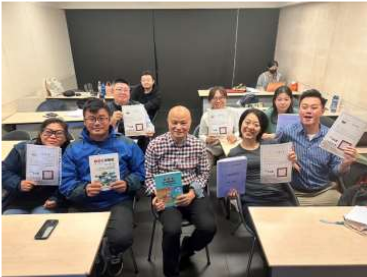
112 年國產雜糧供應品牌推廣與全台灣產雜糧輔導亮點建立計畫 ESG 碳盤查工作坊-出席人員簽名冊